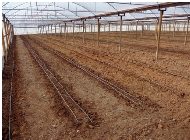
Figure 4: Greenhouse soil ready for planting.